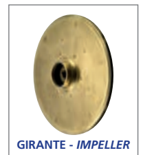
GIRANTE - IMPELLER